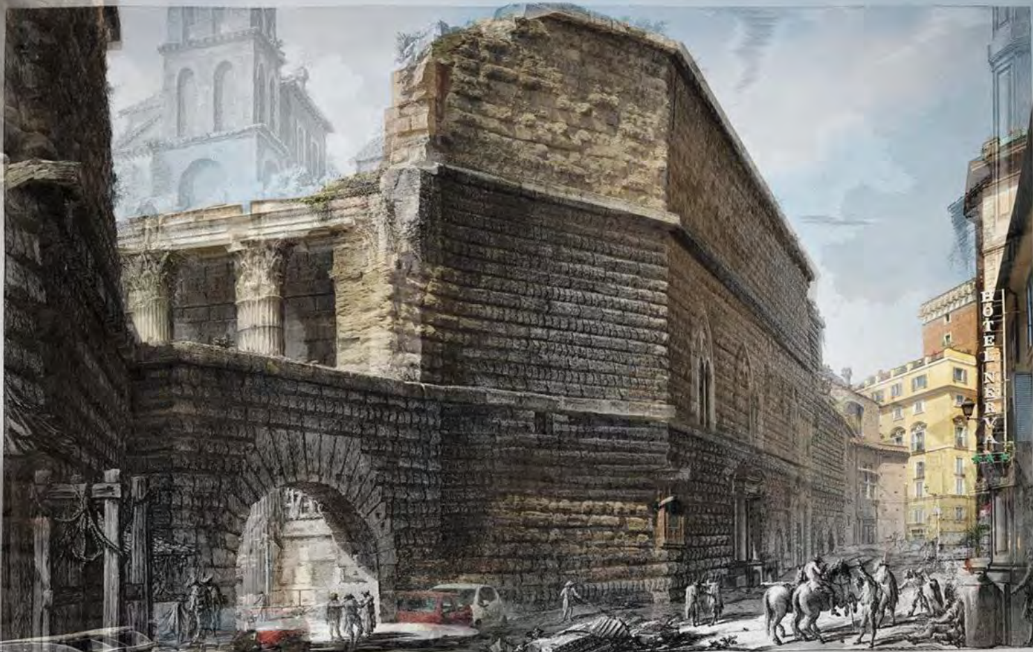
Veduta degli avanzi del