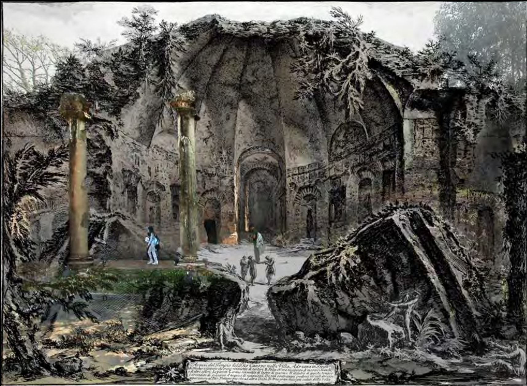
Avanzi del tempio del Dico e annesso nella Villa Adriana in S. Trovato. Si vedono alcune colonne rimaste di piedi. Il Dico è una figura di marmo di un altro ordine. Sopra il Dico rimangono di lastre di marmo. Il diletto di questo tempio è un'isola di sculture d'acqua e di restanti. In tali sculture gradini in cui dicono essere lavoro di Tito. Non sono più che ad altre Dico. Il Dico sono i più nobili della Villa.