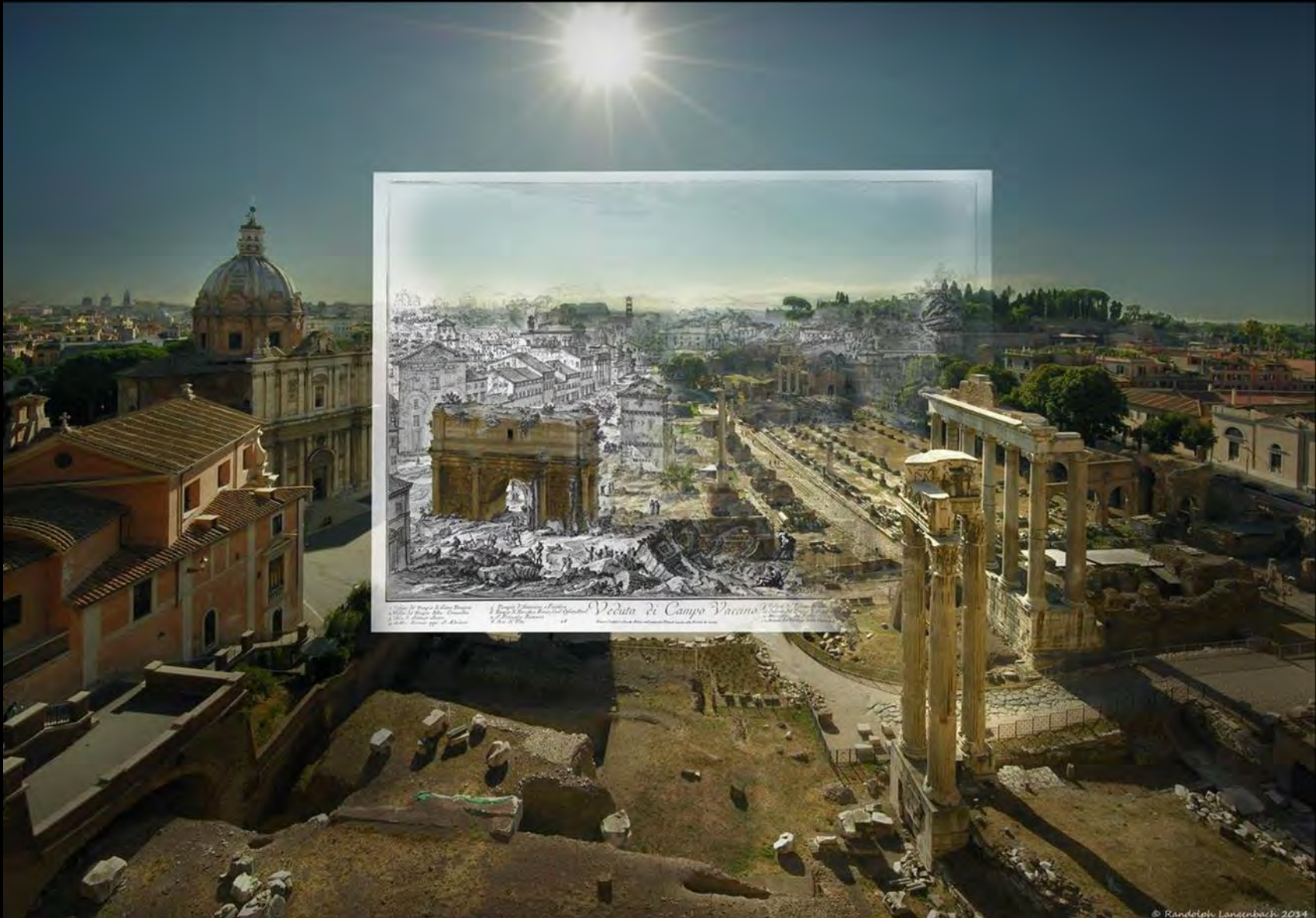
Veduta di Campo Vaccino L. Pannofili del. G. B. Piranesi sculp. 1762