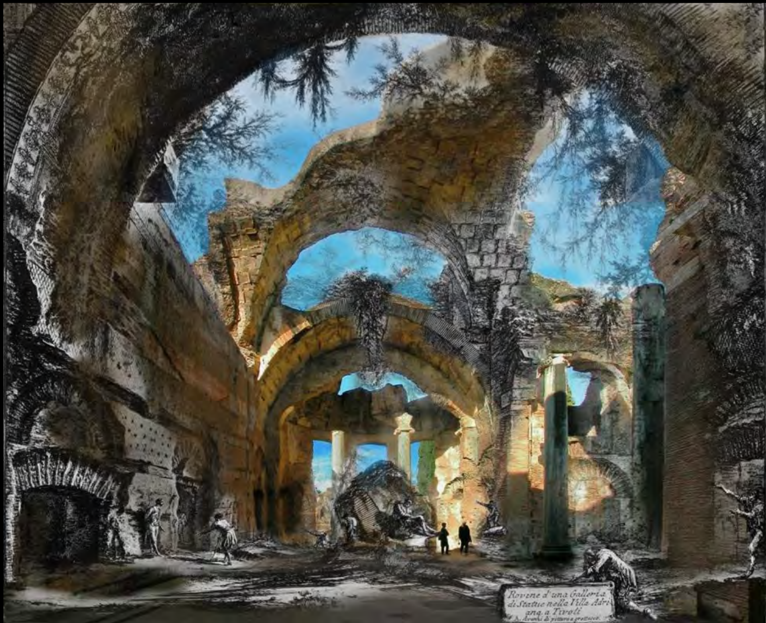
Rovine d'una Galleria di Statue nella Villa Adri- ana a Tivoli di Scabioli di prima e presente.