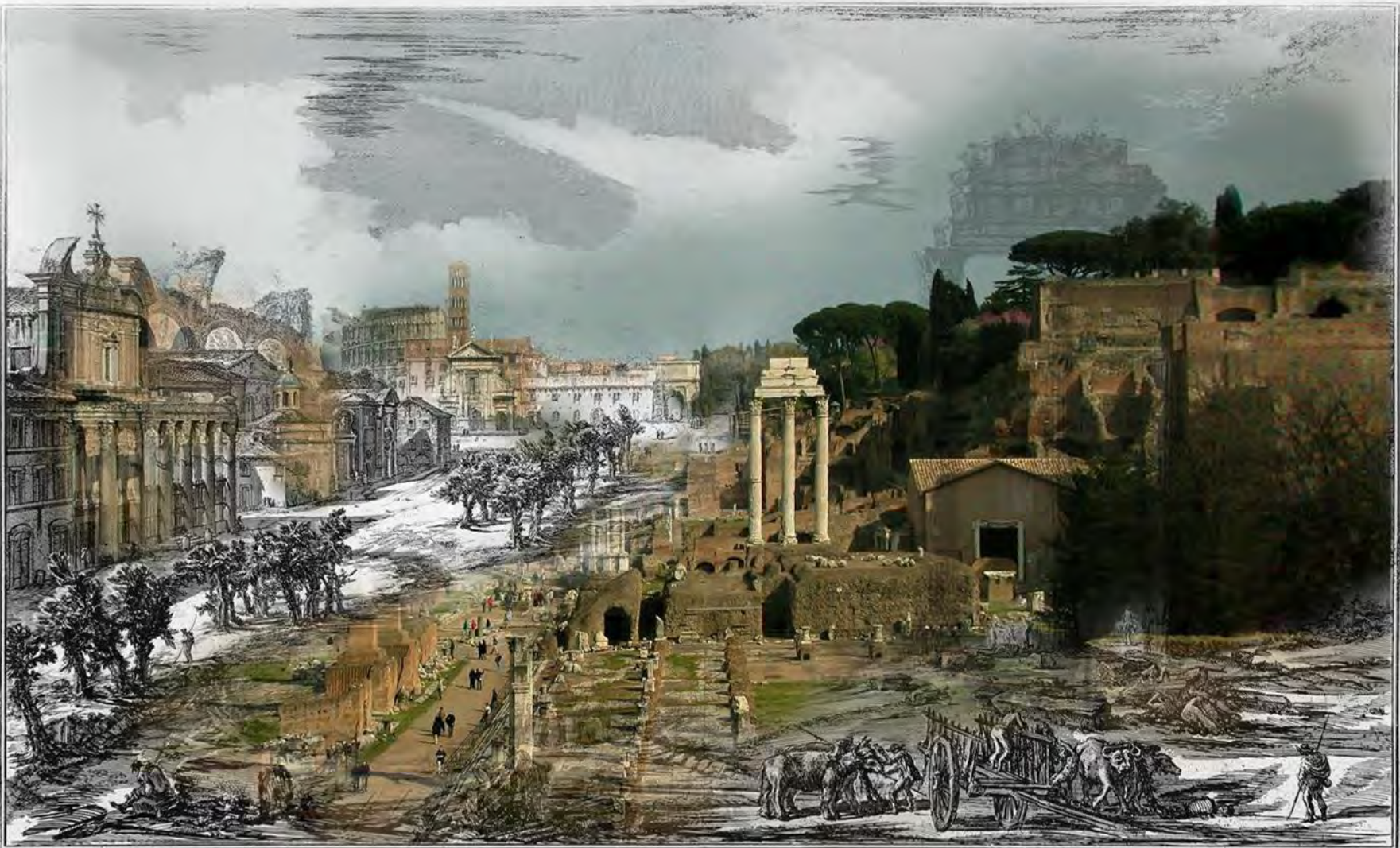
1. Colonne del Tempio detto di Giove Statore. 2. Chiesa di S. Maria Liberatrice piantata sul sito dove anticamente era il