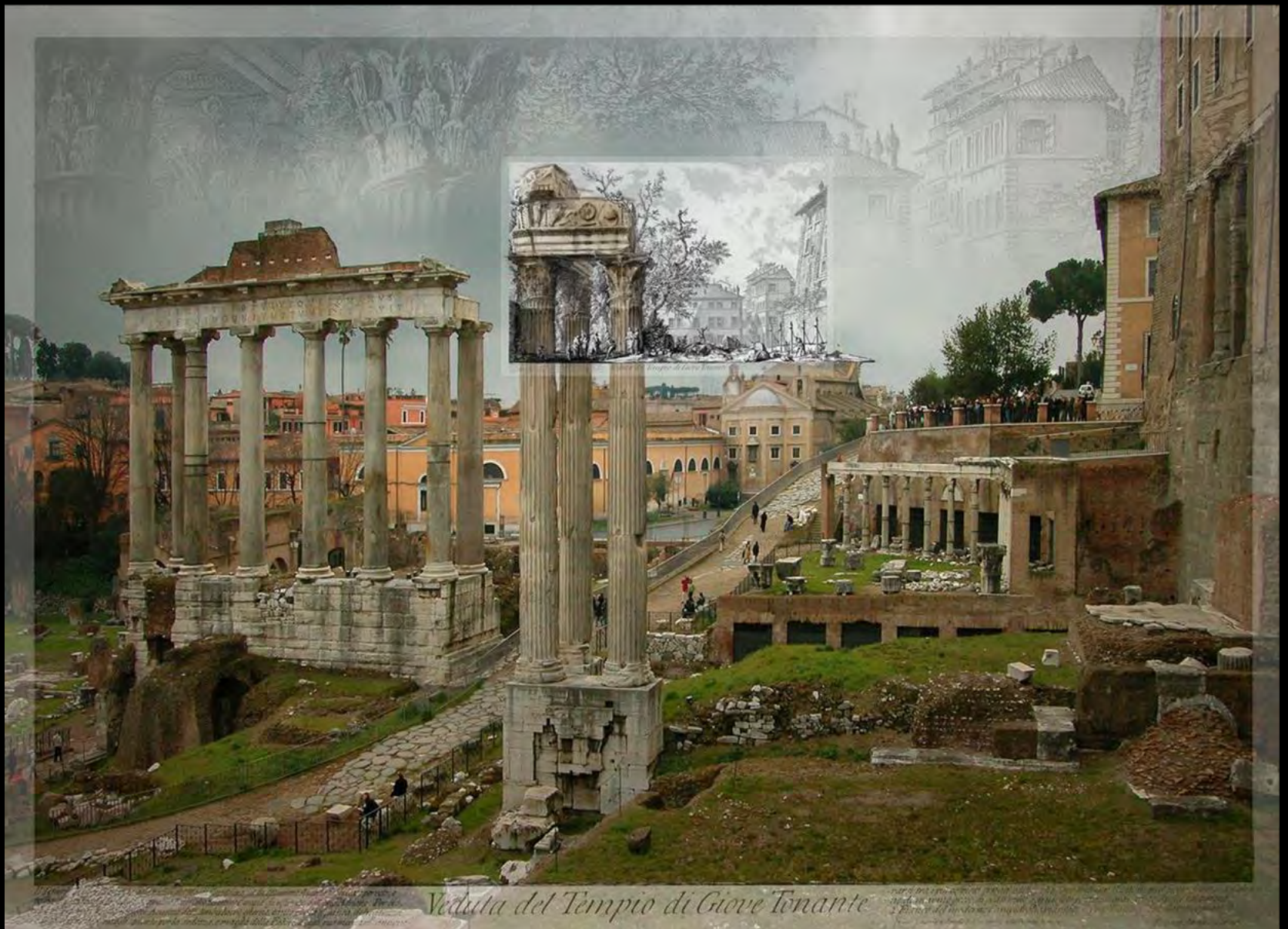
Veduta del Tempio di Giove Tonante